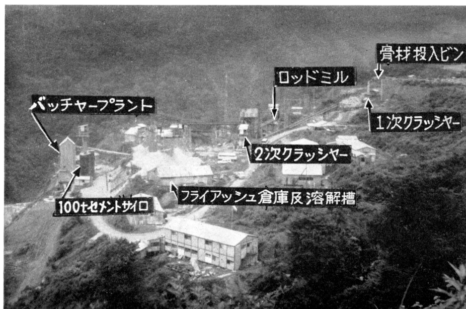
仮 設 配 置