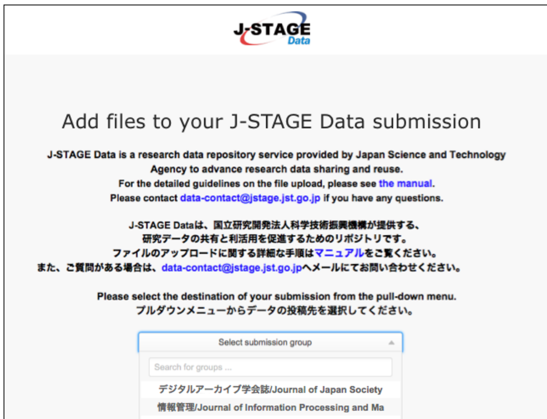
図2. ジャーナル選択メニュー

ジャーナルを選択するには、スクロールしてジャーナル名をクリックします。表示されるジャーナルが多い場合には、テキストボックスの中にジャーナル名の一部を入力して該当するジャーナル名だけに絞り込むこともできます。