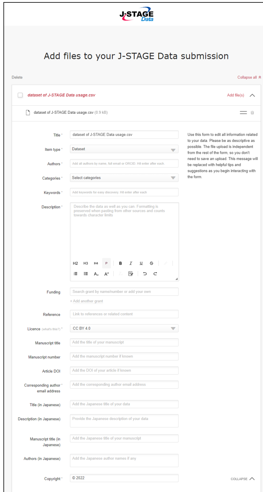
図4. メタデータ入力画面

ファイルのアップロードが完了すると、メタデータの入力画面が表示されます（図4）。